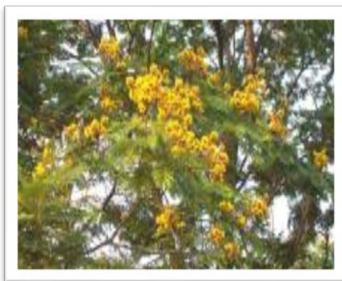
ต้นนนทรี

ต้นนนทรี เป็นไม้ยืนต้น มีอายุยืนยาวนาน มีใบเขียวตลอดทั้งปี ลักษณะใบเป็นฝอยคล้าย ใบกระถิน ดอกสีเหลืองประปรายด้วยสีขาว ช่อดอกเป็นพวงระย้า ฝักไม่ยอมทิ้งต้นทนทานในทุกสภาพ อากาศ ของเมืองไทย วิทยาลัยเทคโนโลยีและการจัดการโนนดินแดง จึงได้เลือกให้เป็นต้นไม้ที่เป็นสัญลักษณ์ ของวิทยาลัยเทคโนโลยีและการจัดการโนนดินแดง เพื่อแสดงว่า ศิษย์เก่าวิทยาลัยเทคโนโลยีและการจัดการ โนนดินแดง นั้นมีใจผูกพันอยู่กับวิทยาลัยตลอดมา และสามารถจะทำงานประกอบอาชีพได้ทั่วทุกหนทุกแห่ง ทั้งในไร่นาป่าเขาทั่วทั้งประเทศไทย