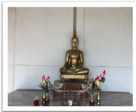
พระพุทธรวิโมกข์

พระพุทธรูปประจำวิทยาลัยเทคโนโลยีและการจัดการโนนดินแดง คือ พระพุทธรวิโมกข์