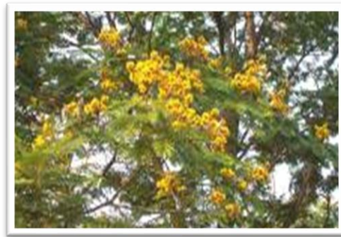
ต้นนนทรี

ต้นนนทรี เป็นไม้ยืนต้น มีอายุยืนยาวนาน มีใบเขียวตลอดทั้งปี ลักษณะใบเป็นฝอยคล้าย ใบกระถิน ดอกสีเหลืองประปรายด้วยสีขาว ช่อดอกเป็นพวงระย้า ฝักไม่ยอมทิ้งต้นทนทานในทุกสภาพอากาศ ของเมืองไทย วิทยาลัยการอาชีพโนนดินแดง จึงได้เลือกให้เป็นต้นไม้ที่เป็นสัญลักษณ์ ของวิทยาลัยการอาชีพโนนดินแดง เพื่อแสดงว่า ศิษย์เก่าวิทยาลัยการอาชีพโนนดินแดง นั้นมีใจผูกพันอยู่กับวิทยาลัยฯตลอดมาและสามารถจะทำงานประกอบอาชีพได้ทั่วทุกหนทุกแห่ง ทั้งในไร่นาป่าเขาทั่วทั้งประเทศไทย