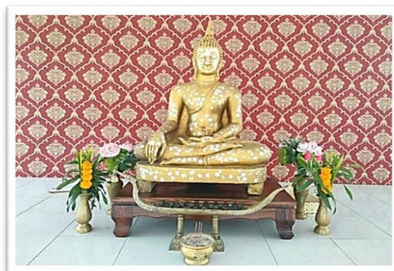
พระพุทธรวิโมกข์

พระพุทธรูปประจำ วิทยาลัยการอาชีพโนนดินแดง คือ พระพุทธรวิโมกข์