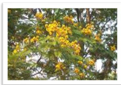
ต้นนนทรี

ต้นนนทรี เป็นไม้ยืนต้น มีอายุยืนยาวนาน มีใบเขียวตลอดทั้งปี ลักษณะใบเป็นฝอยคล้าย ใบกระถิน ดอกสีเหลืองประปรายด้วยสีขาว ซ่อดอกเป็นพวงระย้า ฝักไม่ยอมทิ้งต้นทนทานในทุกสภาพอากาศ ของเมืองไทย วิทยาลัยการอาชีพโนนดินแดง จึงได้เลือกให้เป็นต้นไม้ที่เป็นสัญลักษณ์ ของวิทยาลัยการอาชีพโนนดินแดง เพื่อแสดงว่า ศิษย์เก่าวิทยาลัยการอาชีพโนนดินแดง นั้นมีใจผูกพันอยู่กับวิทยาลัยฯตลอดมาและสามารถจะทำงานประกอบอาชีพได้ทั่วทุกหนทุกแห่ง ทั้งในไร่นาป่าเขาทั่วทั้งประเทศไทย