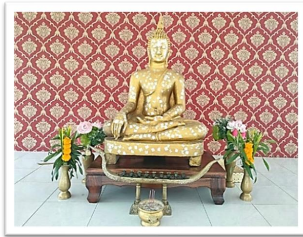
พระพุทธวิโมกข์

พระพุทธรูปประจำ วิทยาลัยการอาชีพโนนดินแดง คือ พระพุทธวิโมกข์